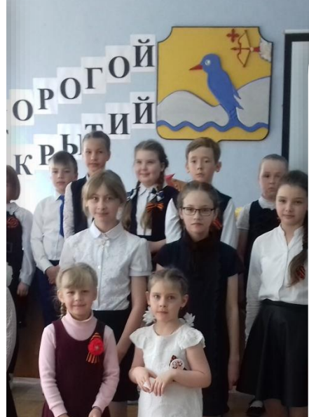
2019 год Исследовательская работа «Клещ - маленький охотник за большими людьми»