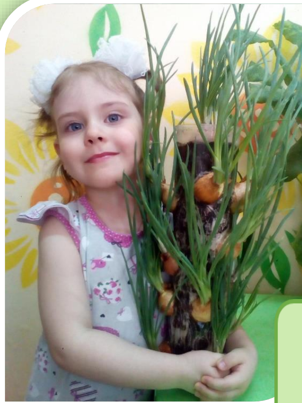
2017 год Исследовательский проект «Луковое дерево»