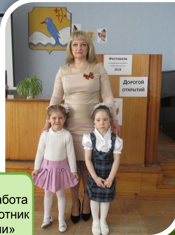
2018 год Исследовательская работа «Эта загадочная плесень»