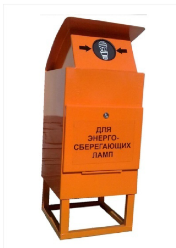
Рисунок 2. Внешний вид контейнера для сбора отработанных ртутьсодержащих ламп

Развитие системы накопления и сбора опасных видов отходов в дальнейшем целесообразно осуществлять централизованно.