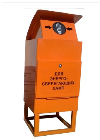
Рисунок 2. Внешний вид контейнера для сбора отработанных ртутьсодержащих ламп

Развитие системы накопления и сбора опасных видов отходов в дальнейшем целесообразно осуществлять централизованно.