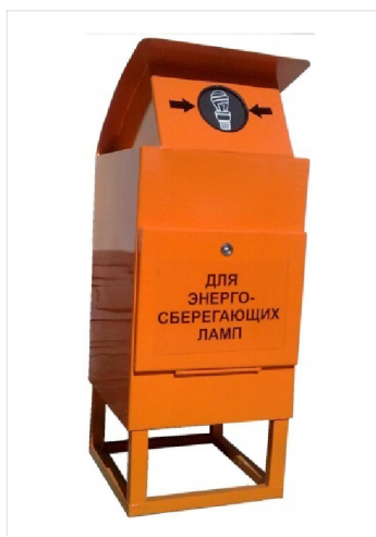
Рисунок 2. Внешний вид контейнера для сбора отработанных ртутьсодержащих ламп

Места накопления отработанных ртутных ламп открытого доступа оборудуются антивандальными специализированными контейнерами, рисунок 2.